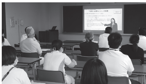
安全管理研修会の様子

鱒ヶ沢病院では、安全管理委員会と医療安全推進室が連携し、院内におけるインシデント※1レポートによる情報の収集、分析、改善策の提案等を行い、医療事故防止のための活動に取り組んでいます。