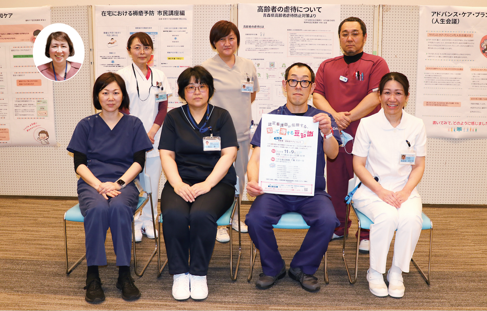
【 市民公開講座を開催した、つがる総合病院の副看護部長と認定看護師のみなさん 】