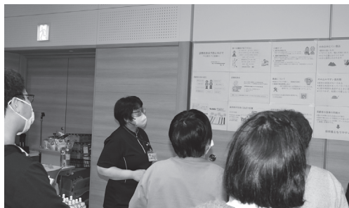
11月9日に開催した市民公開講座の様子

つがる総合病院において、令和6年11月9日(土)に市民公開講座「高齢者・認知症ケア」を開催しました。