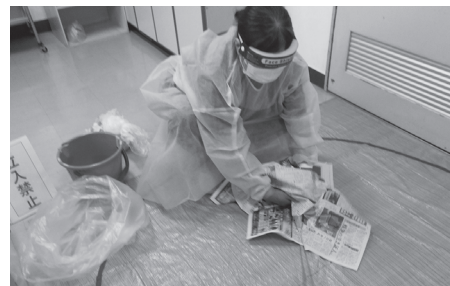
嘔吐物処理法研修の様子

初期対応の誤りで、集団感染を引き起こすケースがありますが、感染性のある嘔吐物を処理する機会は少なく、また、経験のある職員も多くないため、本研修を活かして、嘔吐物による感染拡大の防止につなげていきます。