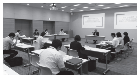
医療的ケア児支援検討会議の様子

つがる西北五広域連合では、令和5年度から医療的ケア児支援検討会議を設置し、圏域に居住されている医療的ケアが必要なお子様やその御家族が地域において適切な支援を受けながら安心して生活を営むことができるよう、医療、福祉、教育、行政といった関係機関との連携強化を図っています。