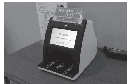
つがる総合病院のカードリーダー (カードリーダーの型式は、 左記の医療機関共通)