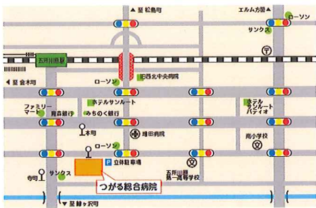
五所川原駅から徒歩で3分、徒歩で7分