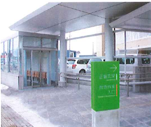
つがる総合病院 バス待合所

※ 上記以外の路線は、病院前に乗り入れしません。「寺町」または「本町」停留所をご利用ください。